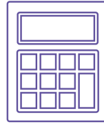
Fiscalité Allégement fiscal temporaire