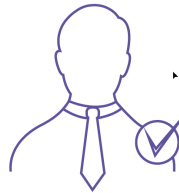
Recrutement Permis de travail