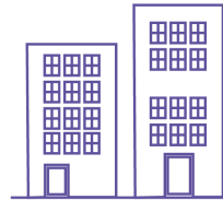
Terrains et locaux