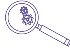
Soutien à l'innovation