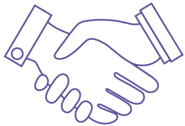
Création de votre entreprise