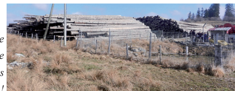
Maison de la rivière Maison de l'écriture Parc à grumes