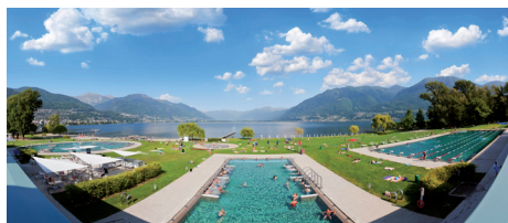
Le Lido de Locarno : un bon exemple !

Les prochaines étapes permettront donc à chacune des communes d'être intégrée au projet en participant à la première capitalisation de la SA. Une réflexion est encore en cours sur les clefs de répartition à élaborer pour permettre à toutes les communes d'adhérer financièrement. D'ores et déjà, la participation moyenne des Communes, hors Morges, sera inférieure à 12 francs par habitant pour permettre de financer les études jusqu'à la fin de la phase de planification.