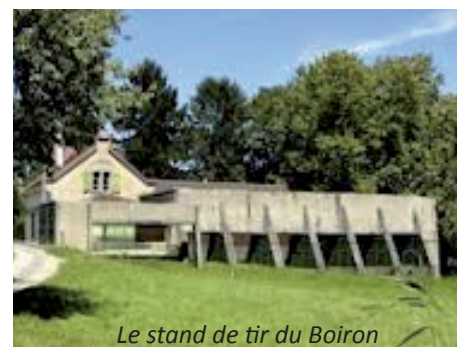
Le stand de tir du Boiron

Ce travail est à votre disposition et vous pouvez nous le demander en nous adressant un simple courriel ou par téléphone.