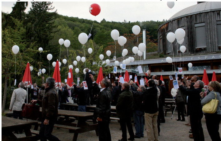
15 mai 2014 : La nouvelle association touristique régionale prend son envol

Pour l'ARCAM, l'étape est importante. Cette nouvelle organisation doit dynamiser les retombées économiques du tourisme en développant une offre diversifiée allant désormais des sapins jurassiens aux rives du lac. Nos atouts sont nombreux et devraient nous permettre de nous imposer comme l'une des destinations touristiques phare du canton de Vaud.