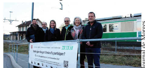
Journal de Morges