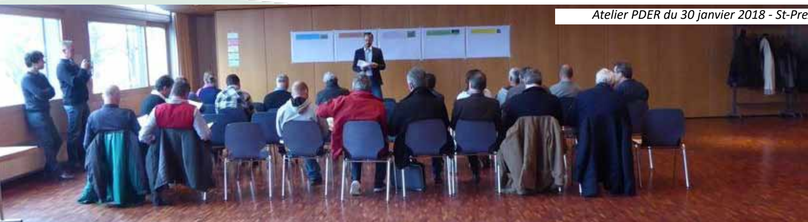
Atelier PDER du 30 janvier 2018 - St-Pre

Leur mise en œuvre sera le fait de différents partenaires.