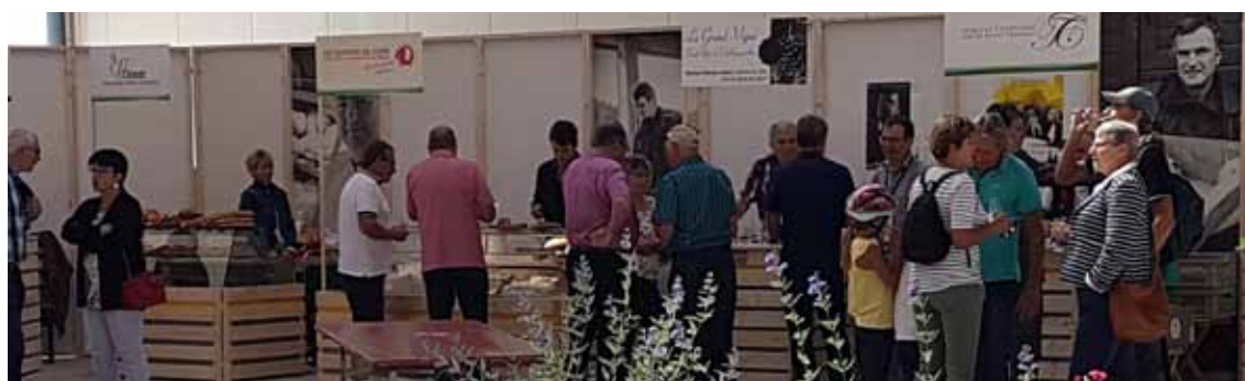
Inauguration de la RC 177, marché du terroir