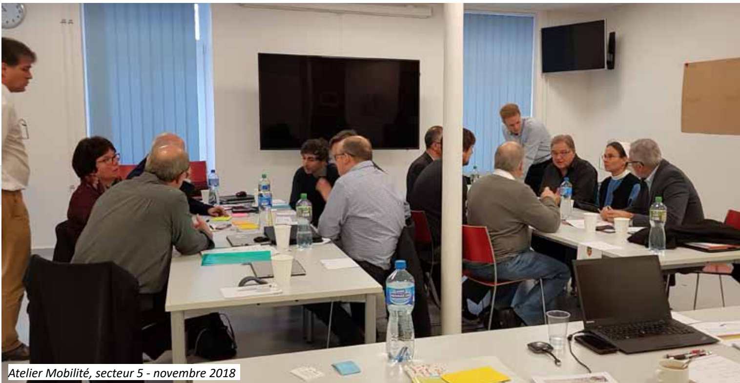
Atelier Mobilité, secteur 5 - novembre 2018

Un projet porté par les MBC prévoit de mettre en place des navettes autonomes au sein de la commune de Cossonay. Il est prévu de mettre en circulation deux navettes. Approché par les MBC, l'ARCAM en collaboration étroite avec l'Association du Gros-de-Vaud a examiné la possibilité d'en faire circuler une autour de la gare Cossonay/Penthalaz, en permettant de desservir également la zone industrielle adjacente de Venoge Parc. Ce projet a été abandonné, n'ayant pas trouvé de soutiens locaux.