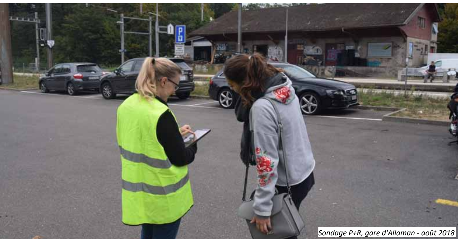
Sondage P+R, gare d'Allaman - août 2018