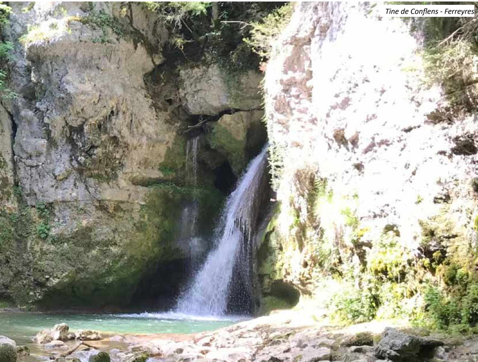
Tine de Conflens - Ferreyres