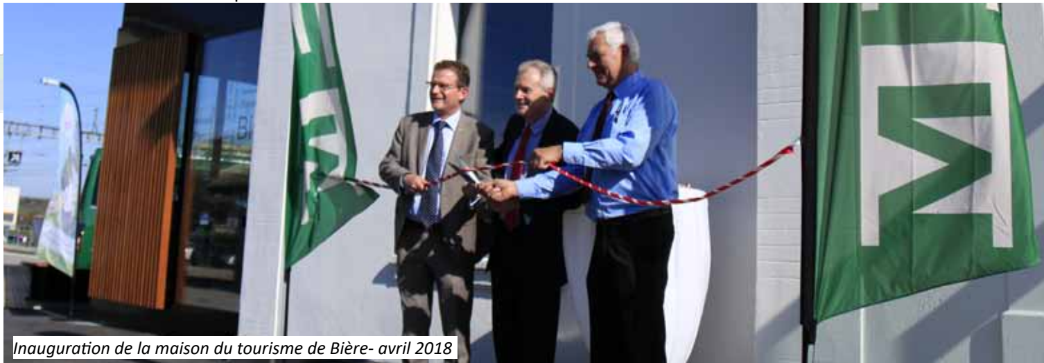
Inauguration de la maison du tourisme de Bière- avril 2018

La Galère, bateau emblématique amarré au large de Morges, n'a pas pu être exploitée durant 2018. L'association "La Galère-La Liberté" a poursuivi ses recherches, avec le soutien de l'ARCAM, pour trouver une solution permettant à la Galère de maintenir ses activités touristiques. La recherche d'un ponton d'amarrage, seul élément pouvant répondre aux besoins de cette structure, est en cours auprès de différentes communes lémaniques.