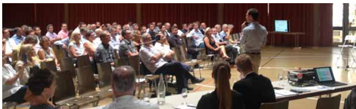
Aubonne, 3e rencontre de l'Economie du district