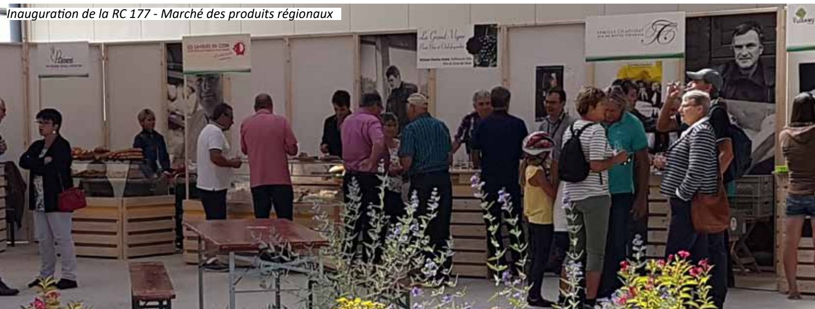
Inauguration de la RC 177 - Marché des produits régionaux